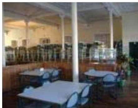
As instalações do Centro de Documentação e Informação

de Fevereiro, trata-se de um interessante e gracioso exemplar da arquitectura do ferro e do ecletismo de finais do século XIX e primórdios do século XX, em Portugal.